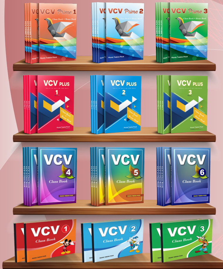
مجموعه کتاب و سیستم انحصاری آموزش انگلیسی به کودکان، نوجوانان و بزرگسالان

در حال حاضر تعداد زیادی از آموزشگاه ها و موسسات زبان در سراسر کشور تحت نمایندگی رسمی وی سی وی در حال فعالیت هستند.