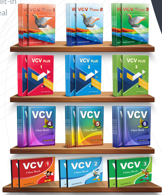
مجموعه کتاب و سیستم انحصاری آموزش انگلیسی به کودکان، نوجوانان و بزرگسالان

لذت یادگیری انگلیسی با وی سی وی TEACH AND LEARN ENGLISH WITH VCV®